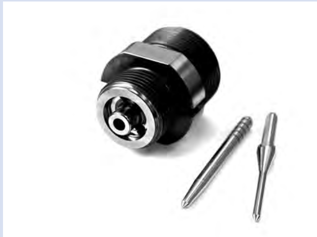
シャットオフノズル